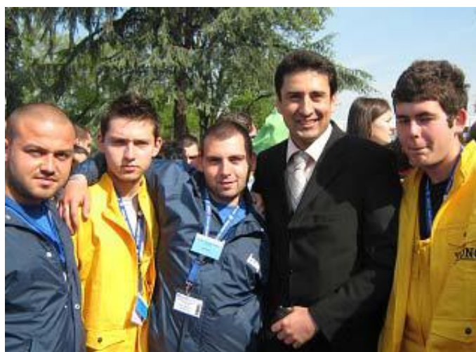
Пловдив, Национално състезание-2010 г. с почетни грамоти от КСБ-ОП-Пловдив