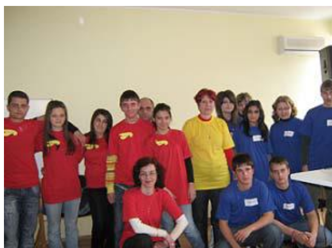
Ежегодно училищно природоматематическо състезание "Сблъсък за една минута"