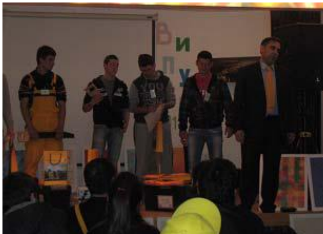
Перник, Регионално състезание-2011 г.