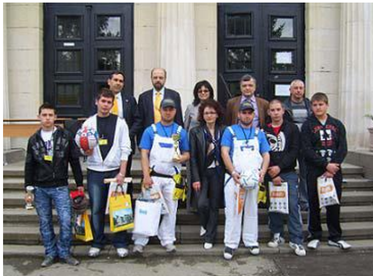
София, Регионално състезание-2010 г.