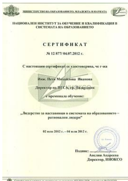
2012 г.-НИОКСО, “Лидерство за наставници в системата на образованието-регионални лидери”