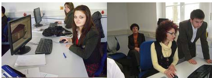
Дрезден-“Европейска строителна практика чрез компютърните технологии”