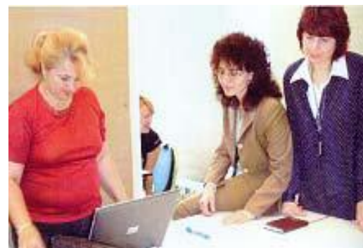
2002 - 2006 г.-“Employment oriented modular training-Balkan Regional Network”-INWENT, Germany.