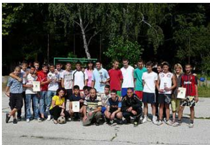
Ежегоден училищен футболен турнир