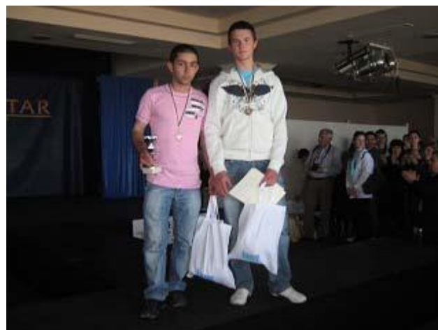
Варна, Национално състезание-2011 г.