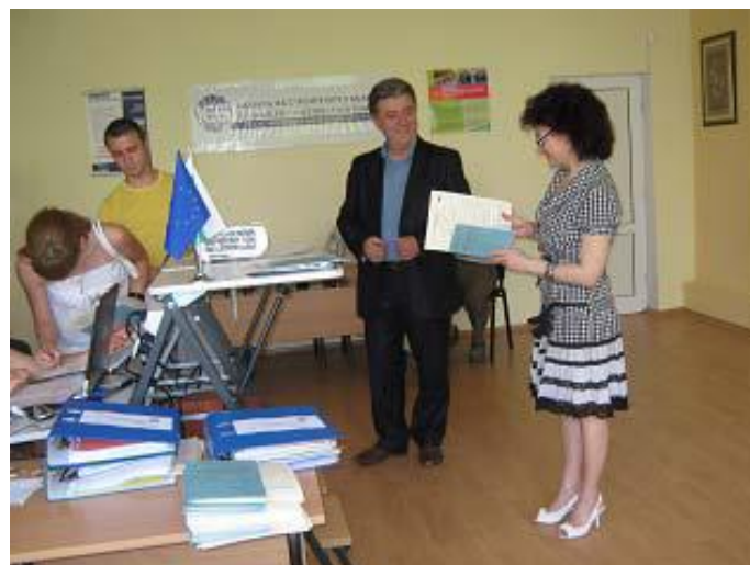
“ ПГСА-гр. Пазарджик и КСБ - за устойчиво партньорство в обучението на строителните специалисти”, ОП “Развитие на човешките ресурси”-2010 г.