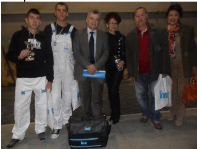
2014г. Панорама на професионалното образование, национално състезание “Най-добър млад строител” – II-ро място специалност “Сухо строителство”;