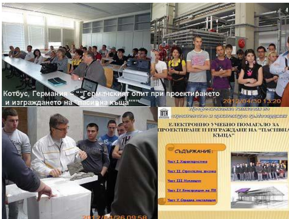
2011-1-BG1-LEO01-04597-2012 г. по програма “Учене през Целия живот”, секторна програма “Леонардо да Винчи”, категория на дейността “Мобилност” – “Германският опит при проектирането и изграждането на "пасивна къща”

“Европейска строителна практика чрез компютърните технологии”, по програма “Учене през целия живот”, секторна програма “Леонардо да Винчи”, категория - “Мобилност”-2011г., Дрезден, Германия