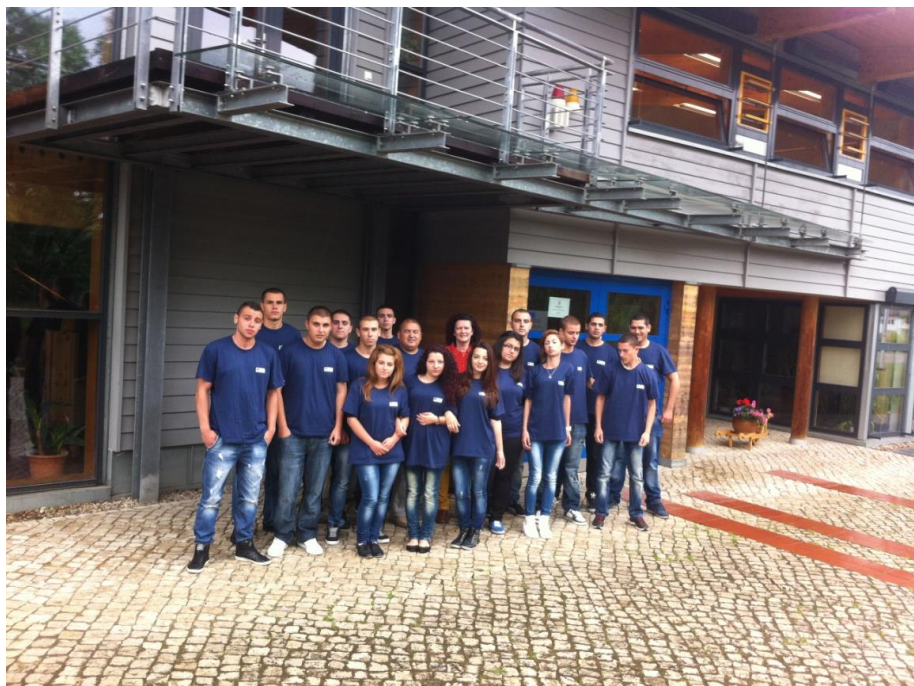
2014-1-BG01-КА102-001222 «Зелено строителство-устойчиво бъдеще» по Европейска програма «ЕРАЗЪМ +», Ключова дейност 1 «Образователна мобилност на граждани», дейността "Мобилност";