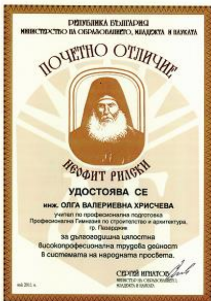
24 май 2011 г.