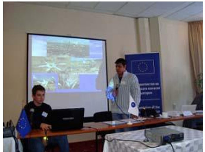
Евроклуб на ПГСА-Пазарджик