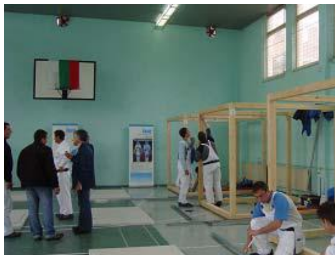
Велико Търново, Национално състезание-2009 г.