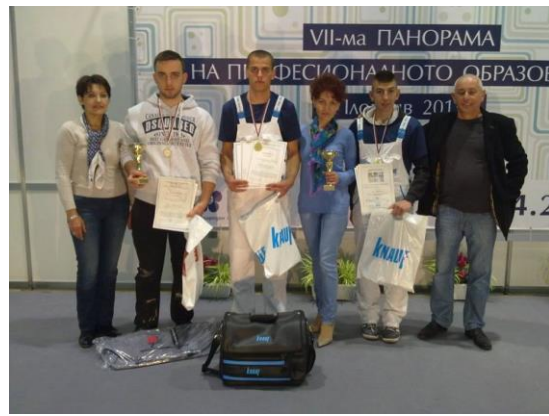
2015 г. международно състезание по сухо строителство Knauf Junior Trophy отборът на ПГСА-гр.Пазарджик за първи път извежда България на престижното второ място от състезаващи се 13 отбора