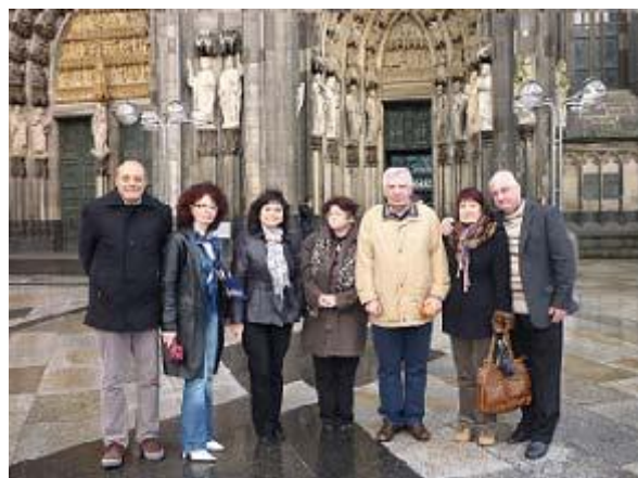
2010 г.- Германия, чрез Камара на строителите в България по проект “Леонардо да Винчи”- мобилност