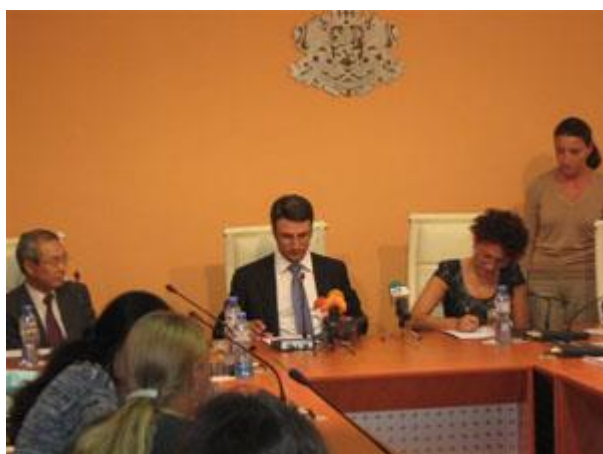
2012 г. JP - “Повишаване на енергийната ефективност чрез подмяна на дограма в ПГСА - гр. Пазарджик” е одобрен с решение от 14.06.2011 г. и с вербална нота от 03.08.2011 г. на японското посолство в Република България